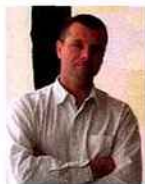
La Philharmonie de Paris, architecte : Jean Nouvel.

Début juillet, le peintre, figure emblématique de l'art actuel à Lyon, est décédé d'une crise cardiaque dans son atelier. Cet infatigable expérimentateur avait 57 ans.